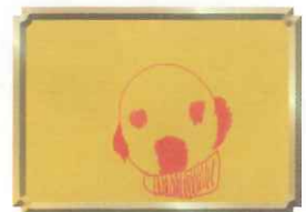
夏原賢治さんの作品 『自分の顔』